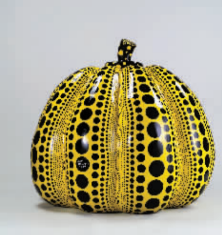
黄永砅《南瓜》成交价272万港元

上周末陆续落槌的香港苏富比春拍,是今年中国春拍的第一槌。截至4月8日,整个春拍交出了成交总额近7亿港元的成绩单,比预估价高出近1亿港元。有媒体认为,这说明亚洲艺术品市场并不萧条,已经透出春天的气息。