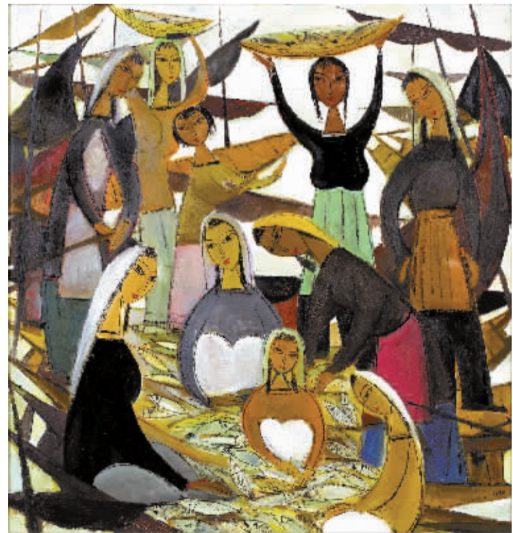
林风眠《渔获》成交价1634万港元