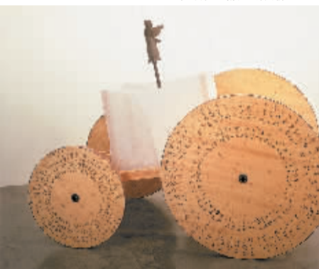
黄永砅《六十甲子年》成交价338万港元