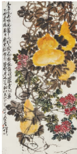
吴昌硕《秋光图》成交价302万港元

对书画拍卖的前景怎么看? 对将来谨慎乐观。在书画拍卖场上几乎感觉不到经济危机。买家竞相举牌,拍场上争得很凶。我觉得只要作品来源清楚,价格合适,成交就没有问题。当然也不是说经济危机对拍卖毫无影响。关键是应对方法要恰当。要针对不同的市场状况,对拍卖策略有所调整,比如专场规模的大小,选件的多少,拍品价格的高低等。当然有的原则是不能退让的,比如选件时对作品的真伪、优劣的把关。